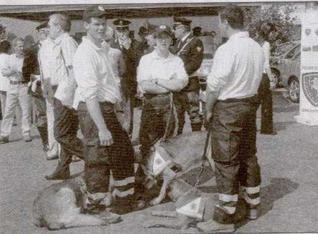
Die Sicherheitskräfte gaben sich gestern am Waltherplatz büroaufnahme. Im Bild die Hundestaffel des Roten Kreuzes.

Abonnements Tel. 0471 92 55 90 abo-service@athesia.it