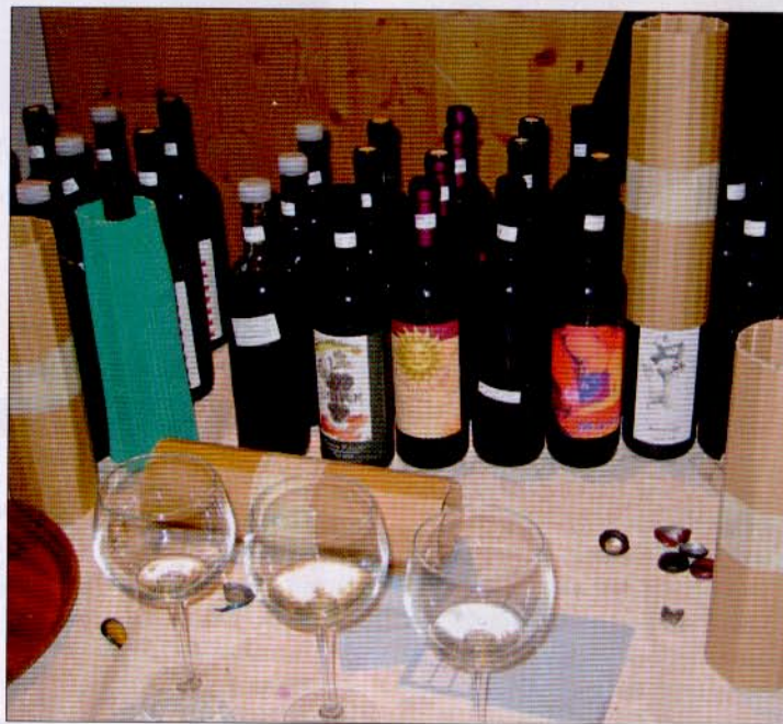
Verkostung in Frangart: Besser als die bekannten Spitzen?